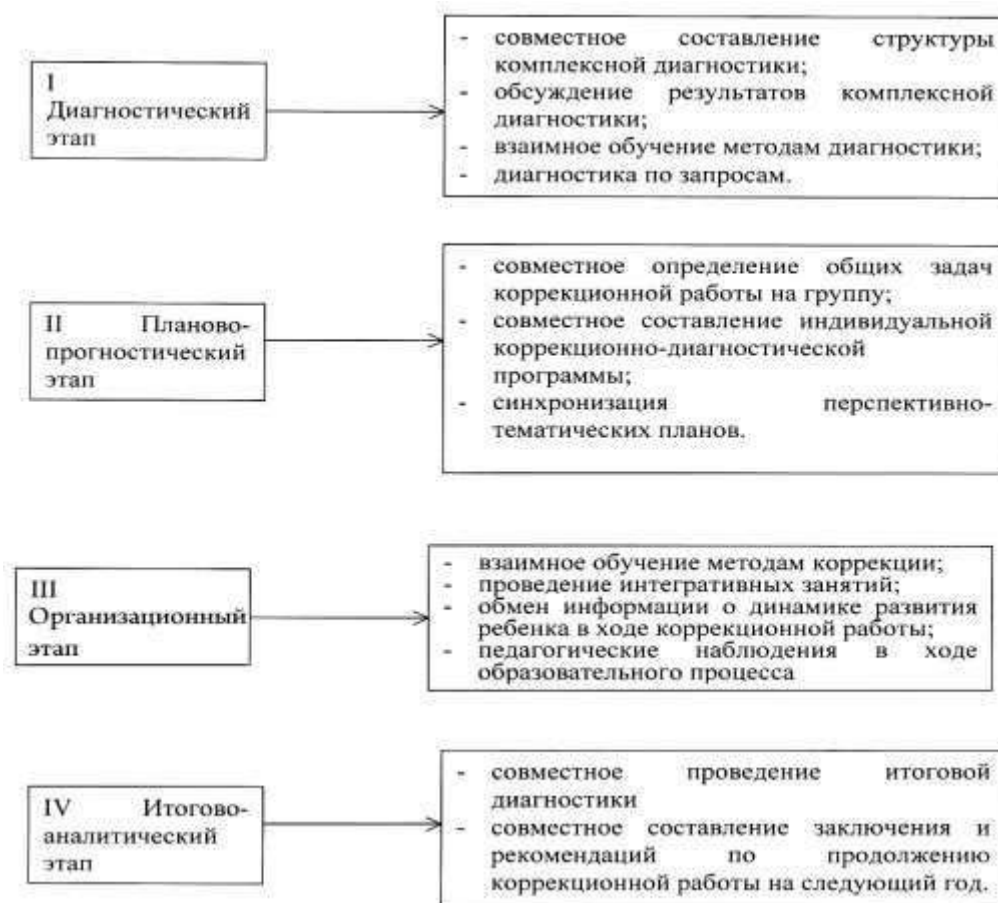
Рисунок 2. Система взаимодействия специалистов в процессе диагностики.

Данные комплексной диагностики каждого воспитанника заносятся в «Карту психолого-педагогического и медико-социального развития ребенка», в которой проектируется разработка Индивидуального коррекционного маршрута развития , в котором систематизируются все наблюдения и рекомендации специалистов, динамика развития ребенка.