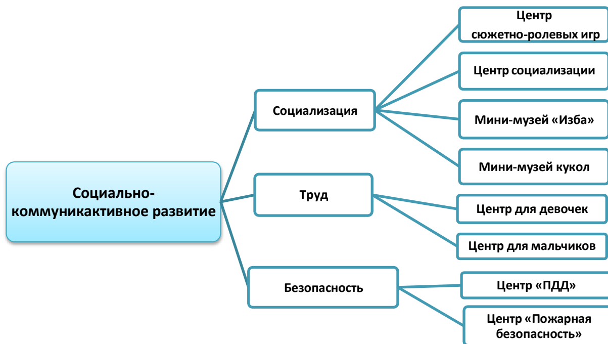
Рисунок 2. Структурная модель предметно-пространственной среды МБ ДОУ №12 Центры детской активности обеспечивают все виды детской деятельности, в которых организуется образовательная деятельность.

Размещение оборудования в группах предполагает гибкое зонирование и возможность трансформации среды с учетом стоящих воспитательных и образовательных задач, а также игровых замыслов детей. Все оборудование сгруппировано по трем пространствам (Таблица 18)