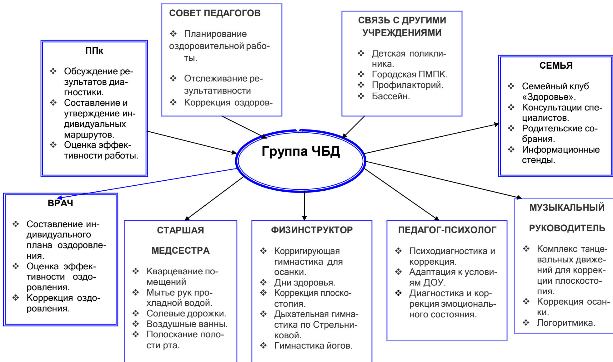
Рисунок 1. Схема организации деятельности с часто болеющими детьми в МБ ДОУ №12