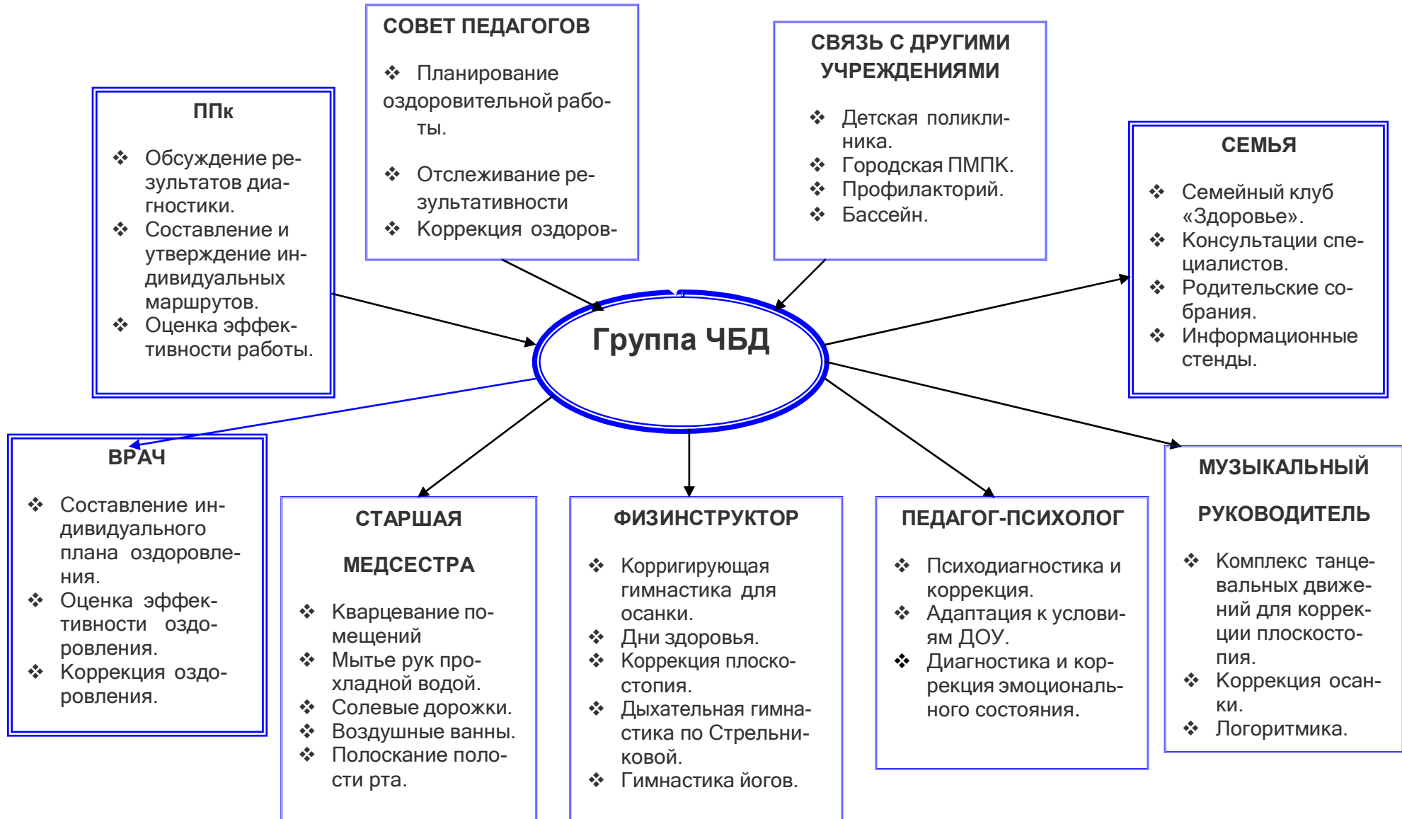
Рисунок 1. Схема организации деятельности с часто болеющими детьми в МБ ДОУ №12